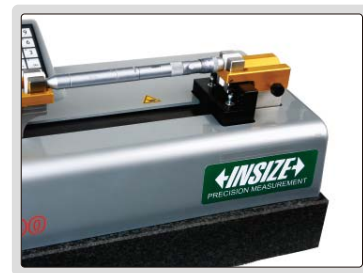
设定或校验管状内径千分尺