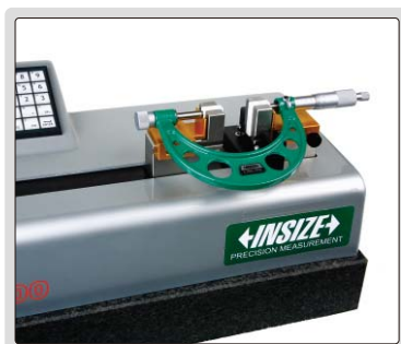
设定或校验外径千分尺