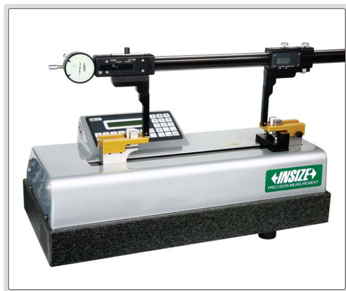
设定或校验多功能数显卡尺