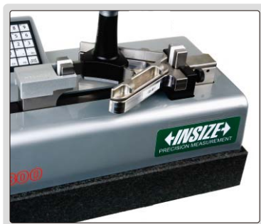
设定或校验三点内径千分尺