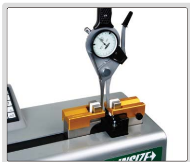
设定或校验内/外卡规