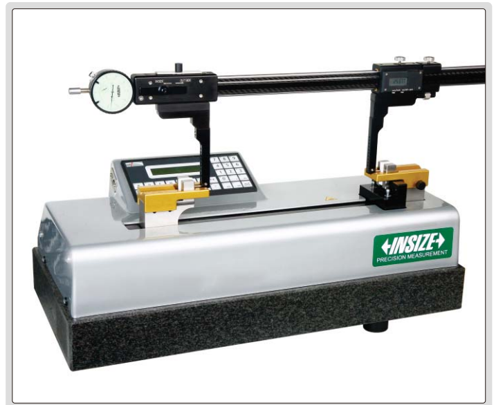
设定或校验多功能数显卡尺