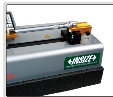
设定或校验管状内径千分尺