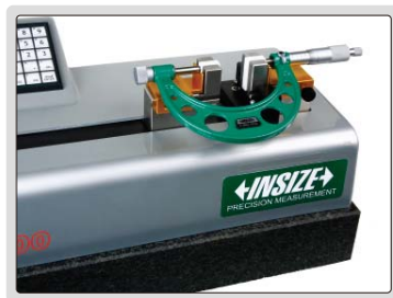
设定或校验外径千分尺