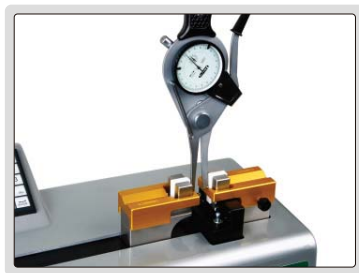
设定或校验内/外卡规