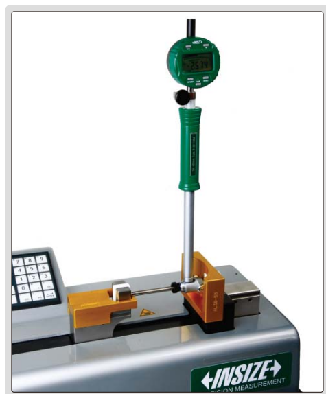
设定或校验内径量表