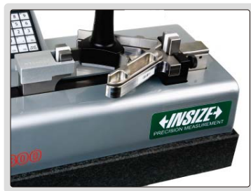
设定或校验三点内径千分尺