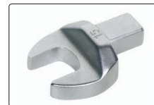
开口扳手头部(标配)