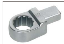
梅花扳手头部(标配, 仅适用于IST-8WM10, IST-8WM20, IST-8WM60)