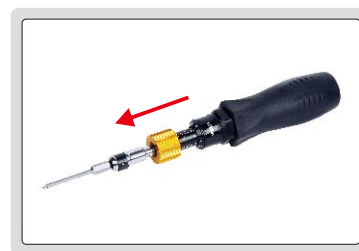
第三步: 松开锁定环