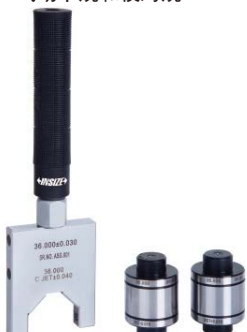
气动卡规和校对规