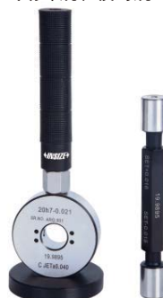
气动环规和校对规