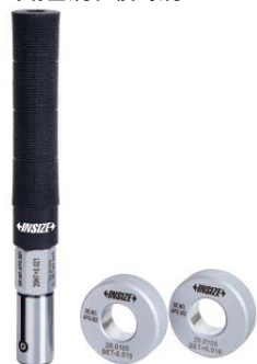
气动塞规和校对规