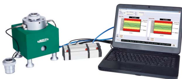
电脑显示(需定制软件)