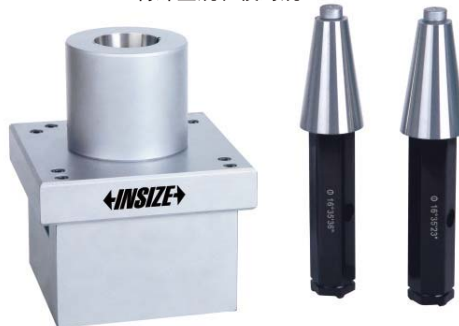
特殊量规和校对规